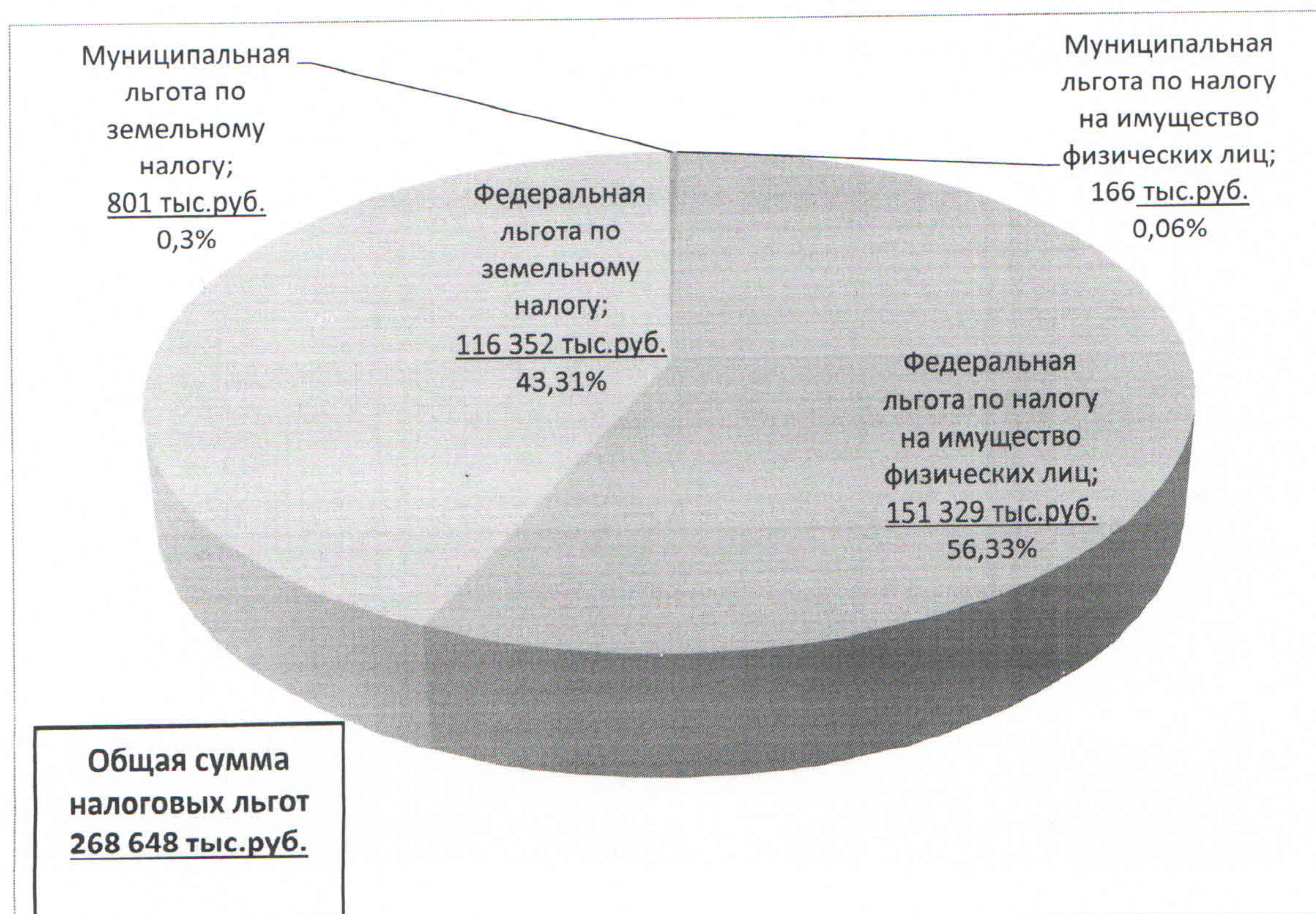
График № 1. Структура предоставленных льгот по местным налогам за 2019 год

В структуре предоставленных льгот по местным налогам (график № 1) наибольшая доля - 56,3% или 151 329 тыс. рублей (в 2018 году 55,3% или 144 947 тыс. рублей) приходится на льготы по налогу на имущество физических лиц, установленные в соответствии со статьями 403, 407 Налогового кодекса Российской Федерации. Наименьшую долю (менее 0,06% или 166 тыс. рублей (в 2018 году 0,07% или 174 тыс. рублей)) составляют льготы по налогу на имущество физических лиц, установленные решениями Совета депутатов города Мурманска.