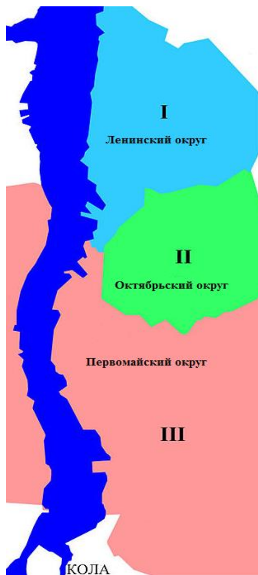
Рисунок 2.3 Существующее административное деление г. Мурманска

Начиная с 2009 г. по настоящее время в г. Мурманске регистрируется снижение годового объема строительства относительно расчетов Генерального плана. Объемы ввода нового жилищного фонда незначительны - ввод нового жилья составляет менее 0,1% от существующего жилого фонда. Такие низкие показатели способствуют старению жилищного фонда, постепенному повышению доли амортизированного жилого фонда, что ухудшает условия жизни населения.